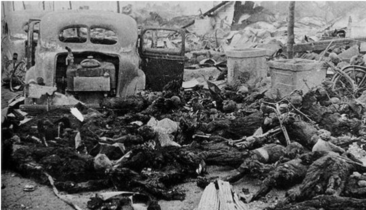
Gambar 1: Dampak bom atom di Hiroshima menimbulkan korban dan kesengsaraan.

menangkal pengaruh nilai-nilai global yang tidak sesuai dengan nilai-nilai kepribadian bangsa Indonesia, kita tidak menepik bahwa perkembangan ilmu pengetahuan saat ini telah banyak mempengaruhi kehidupan generasi kita saat ini, gaya hidup bebas, telah menggeser budaya leluhur.